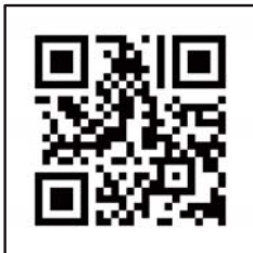
QRコードで検索できます

(株) 消火器リサイクル推進センター コールセンター (03-5829-6773) へお問い合わせください。 受付時間: 9:00~17:00 (土日祝日、休日及び12:00~13:00を除く) https://www.ferpc.jp/