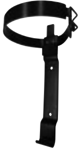
バンドブラケット適合一覧表