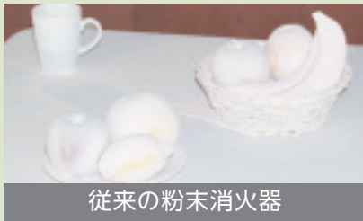
従来の粉末消火器