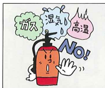
（消防法施行規則第9条第1項第2号）

消火器はそれぞれの防火対象から歩行距離20m以下になるように設置しなければなりません。大型消火器の場合は30mです。