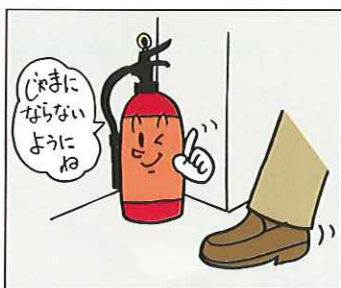
（消防法施行令第10条第2項2号）

通行、または避難に支障がないところで、しかも使用する折に容易に持ち出せる箇所に設置してください。